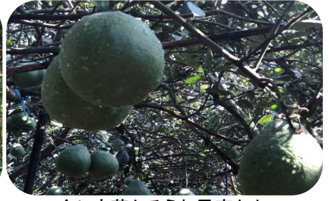
今にも落ちそうな果実たち