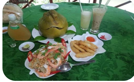
これぞザボンのフルコース！