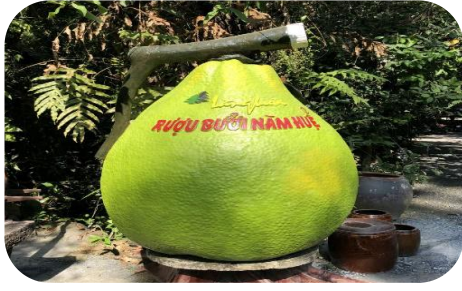
入口では大きなザボンがお出迎え