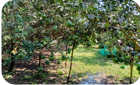
たわわに実るザボン